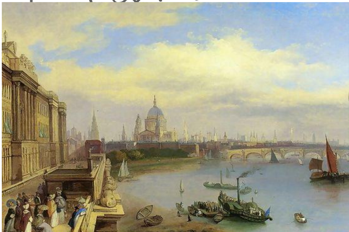
William Parrott (1813-1869)

Postavy procházející se před Somerset House, Katedrála sv. Pavla v pozadí.